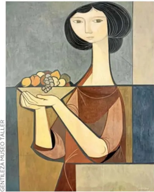
"Mujer con frutera" (1958). La geometría y la proporción áurea son fundamentales en su obra.

Texto, Jimena Silva Cubillos.