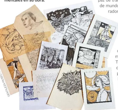
Parte de los dibujos y bocetos, algunos a medio hacer, jamás habían sido expuestos.