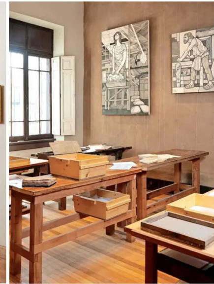
"Anunciación" (2020) y "San José Carpintero" (2012), obras que expresan su apego a la geometría.

El artista junto a "Madre de la Paz", en 2022, en su jardín, espacio que también usa como taller para ejercer distintas disciplinas.